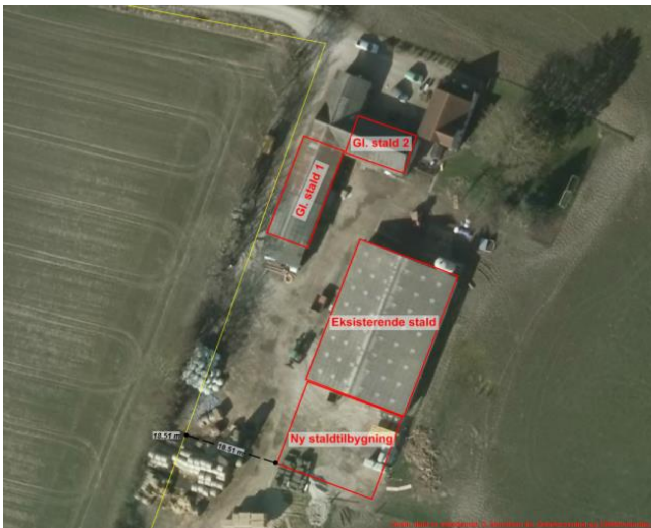
Figur 1 – Anlægstegning. Staldafsnit markeret med rød. Skel markeret med gul.

Ammoniakfordampningen er under 750 kg N – derfor er der ikke krav til BAT.